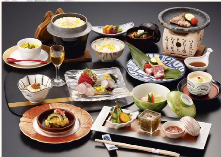
和会席「するが」 ※写真はイメージです。